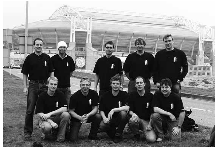
Die Tippgruppe „DPF“ vor der AmsterdamArena

ren 5:1-Sieg einfuhr. Noch aus der Bundesliga bekannt waren Ajax-Trainer Martin Jol und Stürmer Marko Pantelic. Bei Feyenoord saß Roy Makaay auf der Bank, kam jedoch nicht zum Einsatz.